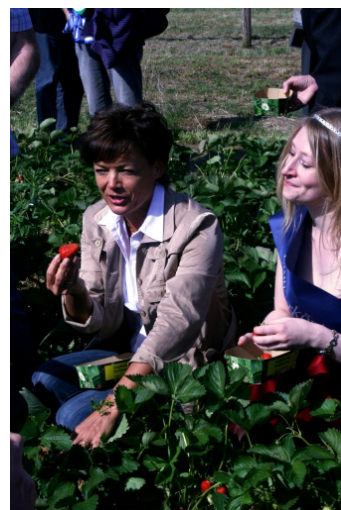
Staatsministerin beim Probieren der selbstgepflückten Erdbeeren