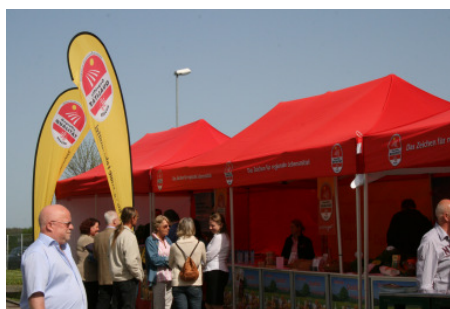
Die Zelte der Qualitätsmarkenbetriebe bei den Feinköstlichen Tagen in Bensheim

Acht Qualitätsmarken-Betriebe aus den Bereichen Bier, Brot und Backwaren, Kräuter, Obst und Gemüse, Fleisch und Wurstwaren sowie Wildspezialitäten überzeugten die Besucher vom Geschmack und der Qualität ihrer Produkte und konnten so den Kunden der Firma FRIPA deutlich machen, in welcher hoher Qualität die im FRIPA-Angebot aufgeführten Qualitätserzeugnisse lieferbar sind. (vb)