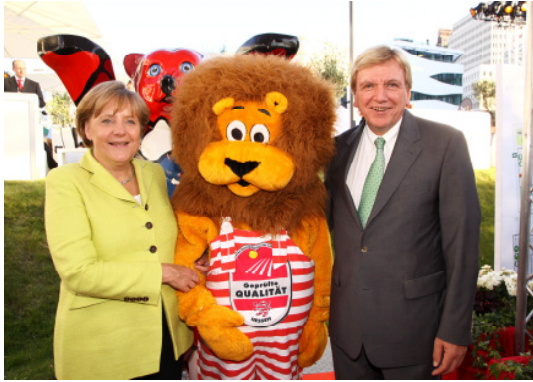
Bundeskanzlerin Angela Merkel und Hessens Ministerpräsident Volker Bouffier gemeinsam mit dem Qualileo auf dem diesjährigen Hessentag in der hessischen Landesvertretung

marke "Geprüfte Qualität – HESSEN", wobei die Fleisch- und Wurstwaren von einem Qualitätsmarkenteilnehmer, der RVF aus Bad Hersfeld, an Bücking geliefert und von diesem verarbeitet wurden.