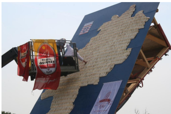
Volker Bouffier vervollständigte die überdimensionale Hessenkarte mit den selbstgestochenen Spargelstangen