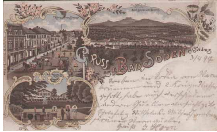
Postkarte aus dem Jahr 1897: oben rechts Blick auf Bad Soden mit Obstwiesen; im Hintergrund der Altkönig und der Feldberg

Diverse Früchte wachsen auf den lokalen Obstwiesen, hauptsächlich Äpfel. Bekannte Sorten wie der Boskop sind dort genauso vertreten wie klassischere, z.B. Kaiser Wilhelm, Bohnapfel oder der Trierer Weinapfel. Da die ältesten Bäume bis zu 80 Jahre alt sind, können noch heute diese Apfelsorten geerntet werden. Da die Obsternte nicht hauptberuflich betrieben wird, lassen die Obstbauern ihre Apfelbäume alternieren. Der Jahresertrag schwankt