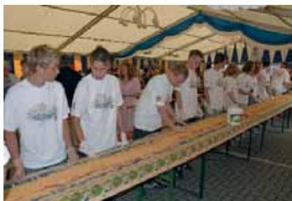
Der Landgasthof Jossgrund in Jossa brutzelte das mit 96,70 Metern längste Schnitzel der Welt und wird in das Guinnessbuch der Rekorde aufgenommen.

Zum Jubiläumsprogramm gehörte ein Weltrekord für das Guinnessbuch der Rekorde: das längste Schnitzel der Welt. Ganze 96,70 Meter lang - offiziell von der Jury gemessen - war es, das in einem Stück gebraten und portioniert zugunsten des örtlichen Kindergartens und der Hilfe für krebskranke Kinder Frankfurt verkauft