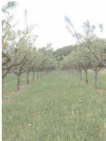
Hochstamm-Pflanzung in Altenhain

In den letzten einhundert Jahren sind etwa 70 bis 90 Prozent der damaligen Streuobstflächen verschwunden. Heutzutage wird in Bad Soden der Erhalt nicht genug gefördert. Nur der Streuobstgürtel um Altenhain ist unter Naturschutz gestellt, alle anderen Wiesen sind akut von Abholzung und Bebauung der Landflächen gefährdet. Für die Obstbauern ist der Verkauf eines Grundstücks mit Aussicht auf Frankfurt rentabler als die Weiterführung der Baumpflege.